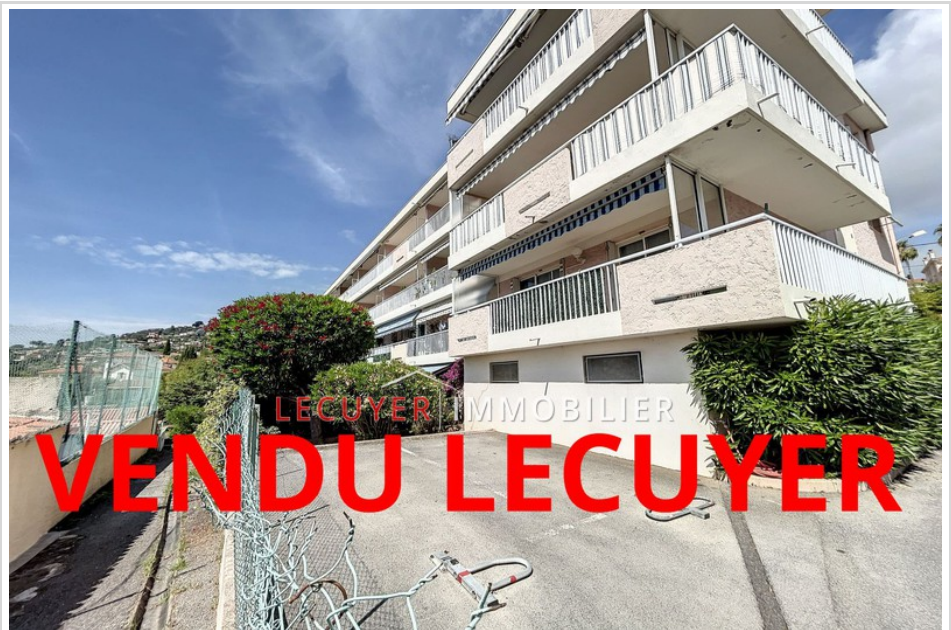
Apartment 51290 Golfe-Juan

Honoraires à la charge du vendeur, well condominium, annual current expenses 864 € (72 € par mois), aucune procédure en cours, information on the risks to which this property is exposed is available on georisques.gouv.fr